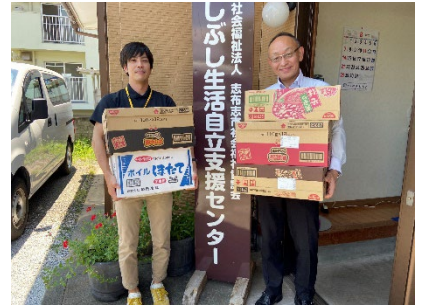
フードバンク大隅