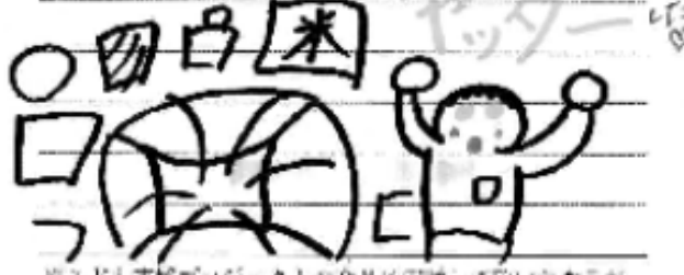
※子ども支援プロジェクトの食品は正確して頂いた食品が 多いため毎日に異なることがあります。

子どもは送って来てくれる日を楽し んでいるので「ねん、そろそろせうか？」 とソワソワしてました。届いた箱を 開いて一品一品「スコーンやちー」と言っ ておにやうべしばらく嬉しそうにながめていま