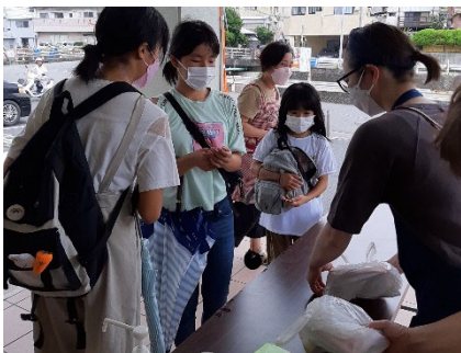
フードバンク奄美