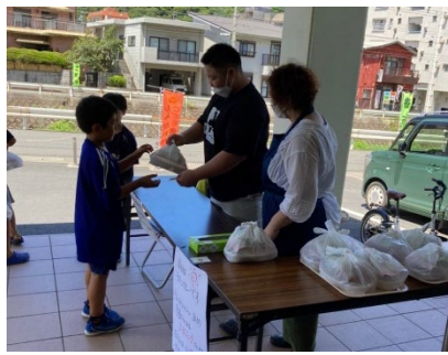
フードバンク奄美