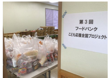
フードバンク茨城