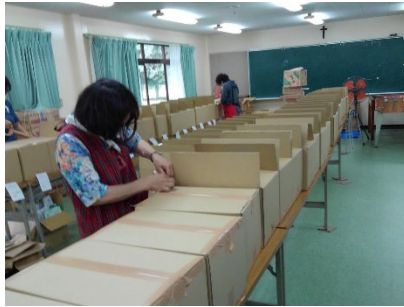
フードバンク調布