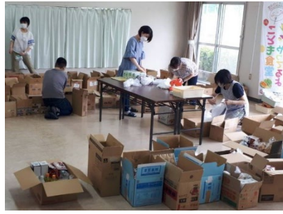
フードバンクてしおて