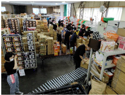
セカンドハーベスト京都

今回もたくさんの食料を寄贈いただき、17,000世帯以上に食品を提供する事ができました。 各団体のスタッフやボランティアの皆様にご協力いただきました。