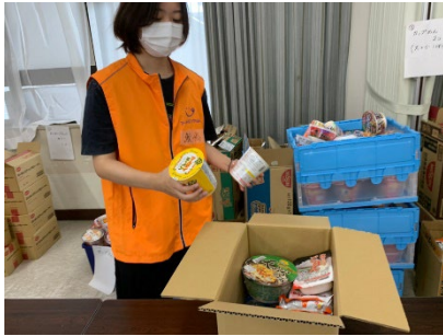
フードバンク山口