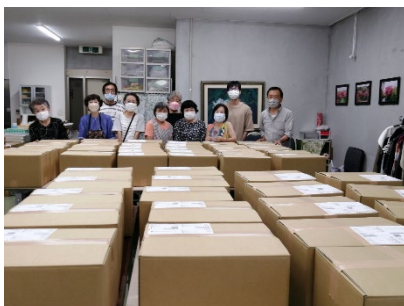
フードバンク八王子えがお