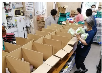
フードバンク八王子えがお