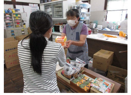
ハーモニーネット未来