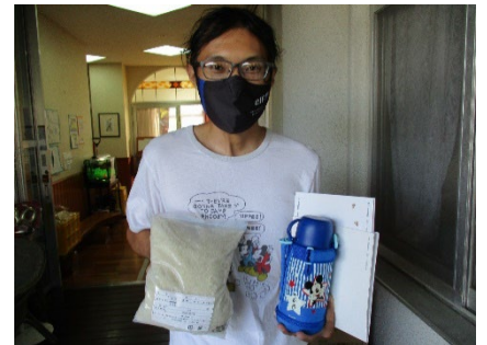
フードバンク熊本