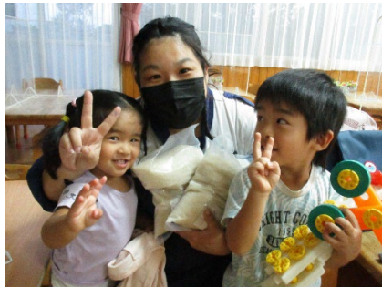
フードバンク熊本