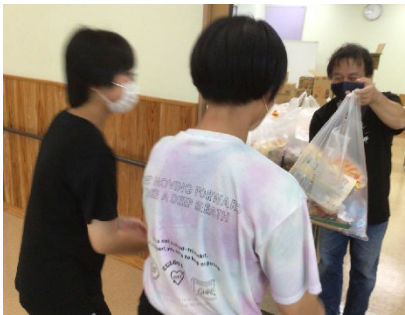
フードバンクそお

箱詰めした食品を子育て世帯へ直接配送する他、各地のフードパントリーや子ども食堂等を通じて食品支援を実施しました。