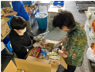
フードバンク山梨