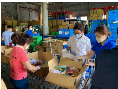
フードバンク山梨