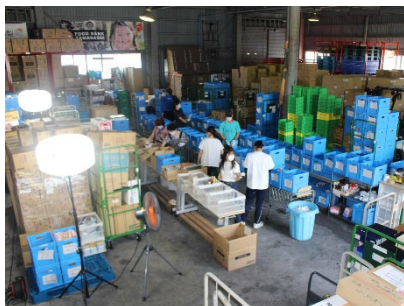
フードバンク山梨