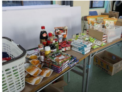
フードバンク調布