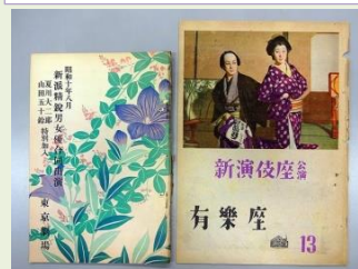
第62回「女優 山田五十鈴」展