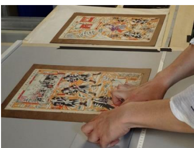
インフォマージュにおける撮影

https://readyfor.jp/projects/ootanitoshokan5/announcements/51493