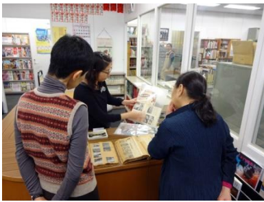
閲覧室机上展示(『二十四の瞳』)