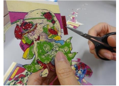
試作品『石橋』組上作業

https://readyfor.jp/projects/ootanitoshokan5/announcements/44550