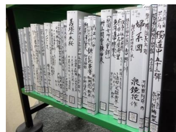
お名入れを待つ台本カバー

第8作『男はつらいよ 寅次郎恋歌』第29作『男はつらいよ 寅次郎あじさいの恋』第42作『男はつらいよ ぼくの伯父さん』『晩春』『白痴』『麦秋』(2件)『運が良けりゃ』『白昼堂々』『キネマの天地』(2件)『八甲田山』『幸福の黄色いハンカチ』『フラガール』『ゆるる』