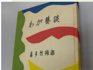
第60回「初代喜多村緑郎」展