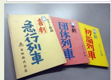
第59回「渥美清-没後20年-」展