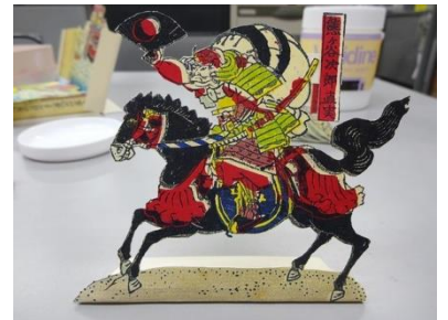
試作品『組討』組上作業

https://readyfor.jp/projects/ootanitoshokan5/announcements/46192