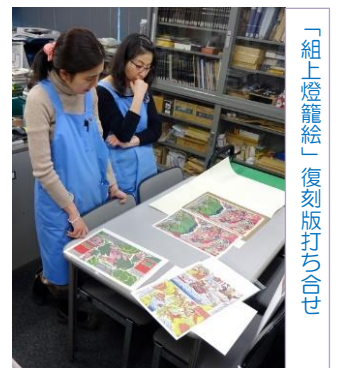
「組上燈籠絵」復刻版打ち合わせ

■今後の予定 平成 29 年度中に「組上燈籠絵」のデジタルアーカイブ化を進め、Web 公開まで行う予定