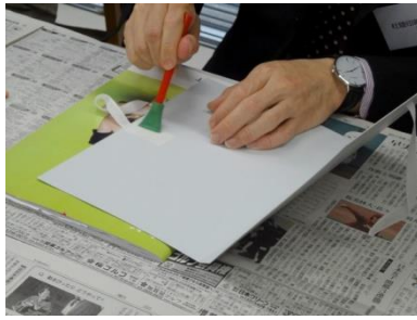
台本カバー作り体験