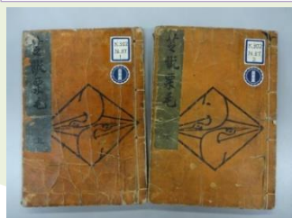
第61回「中村芝翫代々」展