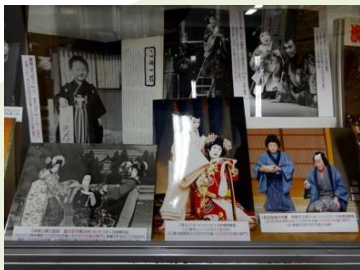
第57回「中村雀右衛門」展