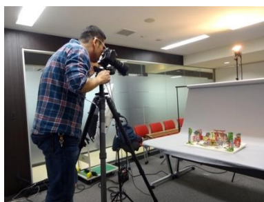
杜陵印刷における撮影