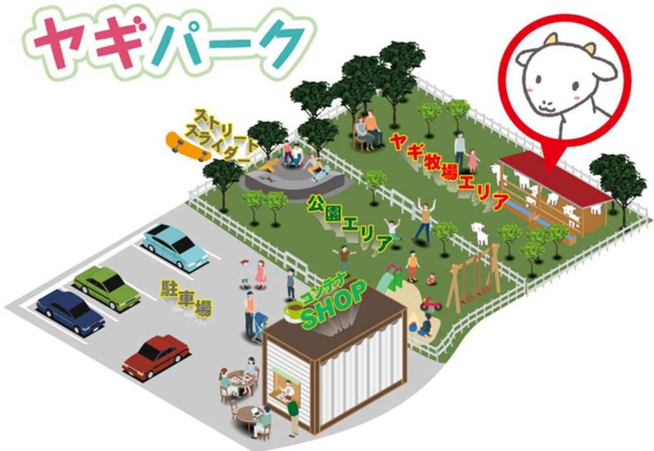
ヤギパーク完成予想図

将来的にはヤギの乳搾り体験などの事業や、コンテナカフェを設置し、飲食もできるスペースを作ること考えています。またオリジナルの山羊乳やチーズの販売も行う予定です。